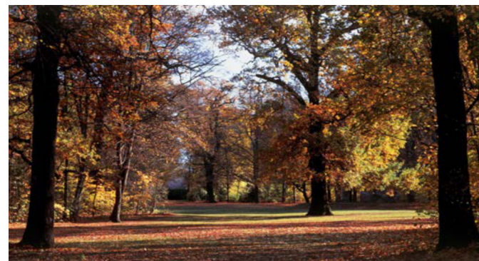
Im Herbst zaubern auf der Eichwiese die uralten Bäume ein prächtiges Farbenmeer. Im Großen Garten gibt es insgesamt etwa 18.000 Bäume, jeder dritte ist über einhundert Jahre alt. Einige Eichen haben bereits das stolze Alter von über 300 Jahren erreicht.

In der Tradition historischer Kaffeehäuser und Gartenwirtschaften bieten fünf gastronomische Einrichtungen stärkenden Imbiss, aber auch gehobene Gastronomie. Herzlich willkommen im Großen Garten und bei den Partnern im Park!