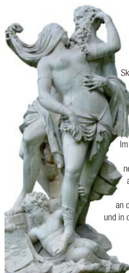
Skulpturengruppe von Antonio Corradini »Die Zeit enthüllt die Wahrheit«

Rund um das Palais und den Schmuckplatz befinden sich Kavaliershäuser, exotische Bäume und Themengärten. Während der sogenannte Weiße Garten ursprünglich weißblühende Gehölze zeigte, wachsen im Staudengarten u. a. farbige und ausladende Rhododendronbüsche und im Dahliengarten über 60 Dahliensorten.