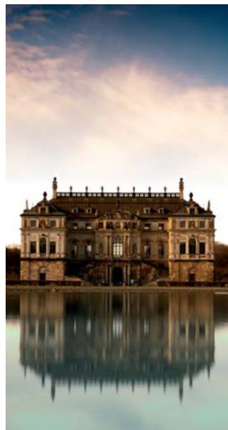
Sie können die Räume des Palais und das Skulpturenlapidarium bei Sonderausstellungen, Veranstaltungen und Führungen besichtigen. Termine unter www.grosser-garten-dresden.de

Heute erstrahlt die Fassade des Palais wieder im alten Glanz,