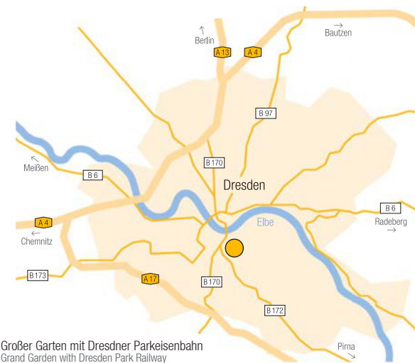
Großer Garten mit Dresdner Parkeisenbahn Grand Garden with Dresden Park Railway

By car exit the Highway A4 at Dresden-Hellerau or Dresden-Altstadt, then follow the signs towards the city centre, the »Zoo«, or »Gläserne Manufaktur«. By tram or bus exit at any of the following stops: Straßburger Platz, Comeniusplatz, Großer Garten (Hygiene-Museum), Lennéplatz, Querallee, Karcherallee und Tiergartenstraße Parking along the Tiergartenstrasse and in neighbouring side streets | Paid parking at the Georg Arnhold Bad