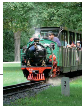
Von April bis Oktober verkehrt die Parkeisenbahn im Großen Garten mit jährlich 250.000 Fahrgästen.

Unzählige Dresdner Familien und Touristen erfreuen sich an der artenreichen Pflanzen- und Tierwelt, die sich hier seit Jahrhunderten entwickeln konnte. Während sich bei schönem Wetter Radfahrer und Jogger auf der Hauptallee tummeln, finden Ruhesuchende in den kleinen Wäldern, Themengärten und auf ausgedehnten Wiesenarealen Zeit für den Genuss dieser großartigen Gartenanlage.