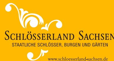
Hrsg. Geschäftsstelle Großer Garten | Stand Juni 2012

Schlösser und Gärten Dresden Geschäftsstelle Großer Garten Grand Garden Hauptallee 5, Kavalliershaus G | 01219 Dresden Telefon Phone +49 (0)351 44 56-600 Telefax Fax +49 (0)351 44 56-722 grosser.garten@schloesserland-sachsen.de www.grosser-garten-dresden.de