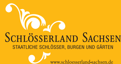
Hrsg. Geschäftsstelle Großer Garten | Stand Juni 2012 | Fotografien Sylvio Dittrich (Schmuckplatz mit Palais), Antje Heinze (Skulptur, Parkeisenbahn), Frank Höhler (Eichwiese), Panthermedia (Titelbild), Peter Pappritz (Staudenbepflanzung) und Andreas Rabending (Palais mit Palaisteich)

Schlösser und Gärten Dresden Geschäftsstelle Großer Garten Grand Garden Hauptallee 5, Kavalliershaus G | 01219 Dresden Telefon Phone +49 (0) 351 44 56-600 Telefax Fax +49 (0) 351 44 56-722 grosser.garten@schloesserland-sachsen.de www.grosser-garten-dresden.de