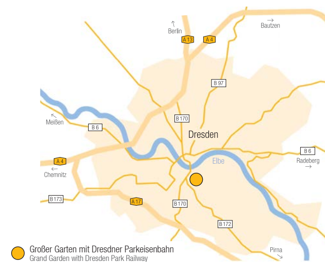
● Großer Garten mit Dresdner Parkeisenbahn Grand Garden with Dresden Park Railway

By tram or bus exit at any of the following stops: Straßburger Platz, Comeniusplatz, Großer Garten (Hygiene-Museum), Lennéplatz, Querallee, Karcherallee und Tiergartenstraße Parking along the Tiergartenstrasse and in neighbouring side streets | Paid parking at the Georg Arnhold Bad